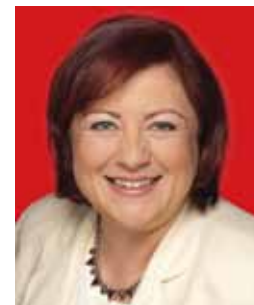
Dr. Bärbel Kofler

Geboren am 14.11.1954 Beruf: Theologe Landesliste Rheinland-Pfalz zuständig für den Wahlkreis Kreuznach [202]