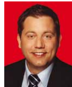
Lars Klingbeil (neu gewählt)

Geboren am 23.02.1978 Beruf: Politikwissenschaftler Landesliste Niedersachsen zuständig für den Wahlkreis Rotenburg I - Soltau-Fallingb. [36]