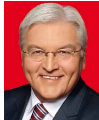
Dr. Frank-Walter Steinmeier MdB Vorsitzender der SPD-Bundestagsfraktion

Die SPD-Bundestagsfraktion ist die größte Oppositionsfraktion im Deutschen Bundestag. Damit kommt uns eine besondere Verantwortung zu. Wir werden der Regierung ganz genau auf die Finger schauen. Aber wir werden vor allem auch zeigen, dass wir über die besseren Zukunftskonzepte verfügen. Deshalb muss die SPD-Bundestagsfraktion möglichst schnell handlungsfähig und schlagkräftig werden. Die Voraussetzung hierfür haben wir in den letzten Wochen mit der Aufstellung der neuen Fraktionsführung geschaffen. Die Fraktion muss in den kommenden vier Jahren ein Kraftzentrum der Sozialdemokratie sein.