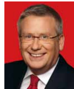
Fritz Rudolf Körper

Geboren am 14.06.1937 Beruf: Jurist Direktmandat des Wahlkreises Hamburg-Bergedorf - Harburg [24] (Hamburg)